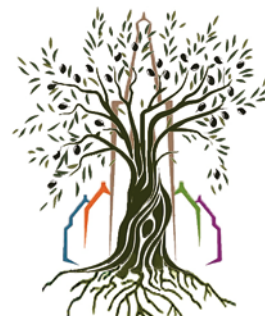
Romeinen 11: 13-32

Ons TFT is hard aan het werk om dingen voor onze terugkeer te regelen, zoals het vinden van huisvesting, fietsen, een auto, kleding, budgettering voor leefkosten in Nederland omdat die anders zijn dan in PNG, etc. Mocht u/jij ideeën, tips, tijd of financiën beschikbaar hebben wat betreft onze terugkeer; ze horen het graag! Reageren kan via info@wydaar.nl .